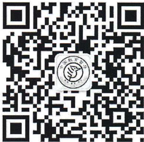
（中国教育督导微信公众号二维码）

省级人民政府履行教育职责情况满意度调查依托“中国教育督导”微信公众号实施。调查对象扫描“中国教育督导”微信公众号二维码（如下），选择“关注公众号”。进入该微信公众号界面后，点击首页底部“互动平台”菜单，选择“政府履责情况调查”，进入问卷填答；选择“举报平台”，进入举报系统留言，提供举报线索。填答人根据各自身份（社会人士、教师和学生），选择相应问卷填答。填答人提交问卷和问题举报后，将自动上传至系统后台，以保证调查过程公正、问卷结果和问题举报内容保密。